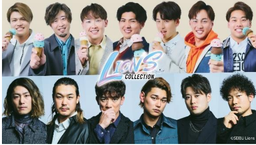
LIONS COLLECTION 第1弾 キービジュアル