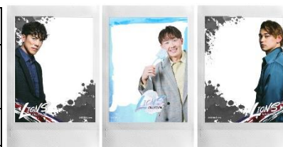
オリジナルチェキ フレーム イメージ